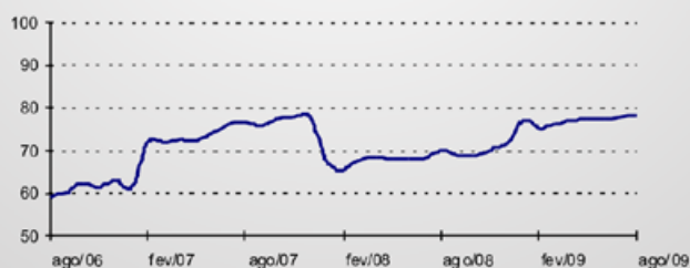
PESSOAL EMPREGADO Índice base média 2004=100